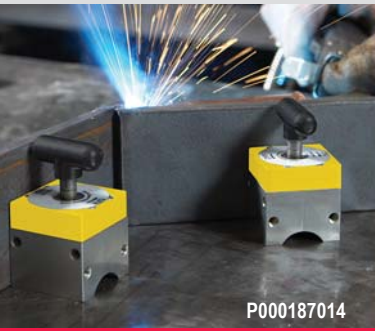
P000187014 Uitlijnen van twee werkstukken. Rond of Vlak.