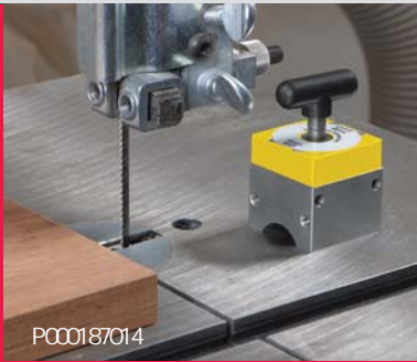
P000187014 Gebruik de magneet als stop, overall in te zetten.

Lassers zijn enthousiast over het gebruik, gemak en tijds besparing met MAGSWITCH MagSquares. MagSquares extreem krachtige aan/uit magnetische blokken. Deze kracht is aan de vijf zijden te gebruiken. Voor de lassers is het een genot om met complete controle over ongelooflijk sterke magneten te kunnen werken. Je kan zeer precies de plaats van de