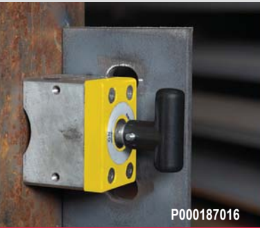
P000187016 Snel exact 90 graden hoeken verkrijgen.