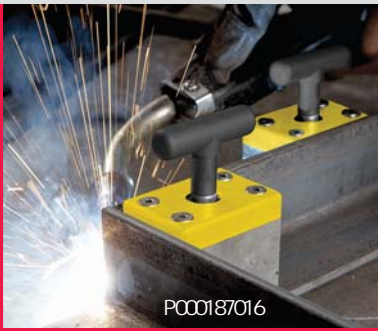
P000187016 Snel hoeken uitzetten of samenbrengen.